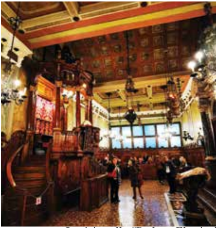
In visita alla "Padova Ebraica"