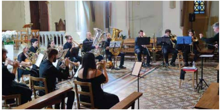
Gli ottoni del Conservatorio di Vicenza "Pedrollo Brass Ensemble"

in quella che è stata la prima e più grande Sinagoga Ashkenazita, di origine tedesca appunto, fondata nel 1522 e attiva fino al maggio del 1943, quando venne incendiata da un gruppo di fascisti padovani.