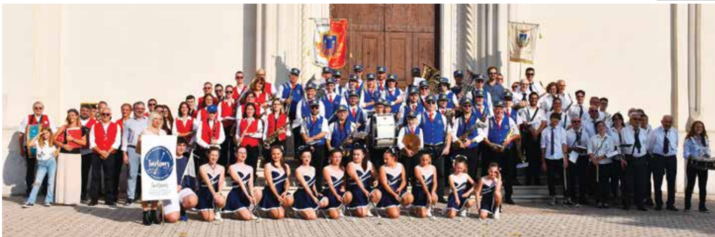
1ª Rassegna Bandistica Campigliese