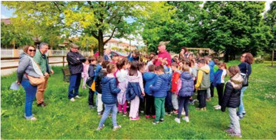
Incontro con gli Alpini