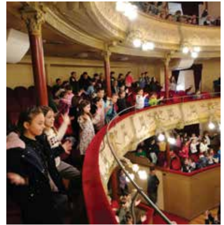
In teatro a Lonigo

tramite i manufatti e i cartelloni svolti, la frutta tipica di questa stagione. I cartelloni e i lavori esposti sono la sintesi delle attività laboratoriali svolte in classe.