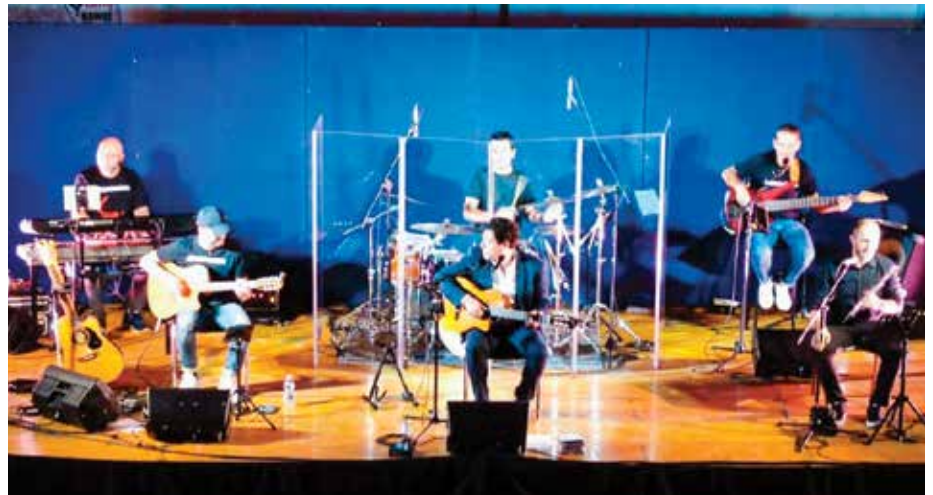
Tributo a Fabrizio De André

L'Aron-ha Kodesh, l'armadio sacro, contenente i libri sacri, è posizionato sulla parete Este dell'aula, rivolto verso Gerusalemme e guarda la Bimah, il leggio, posizionato in alto, come un pulpito