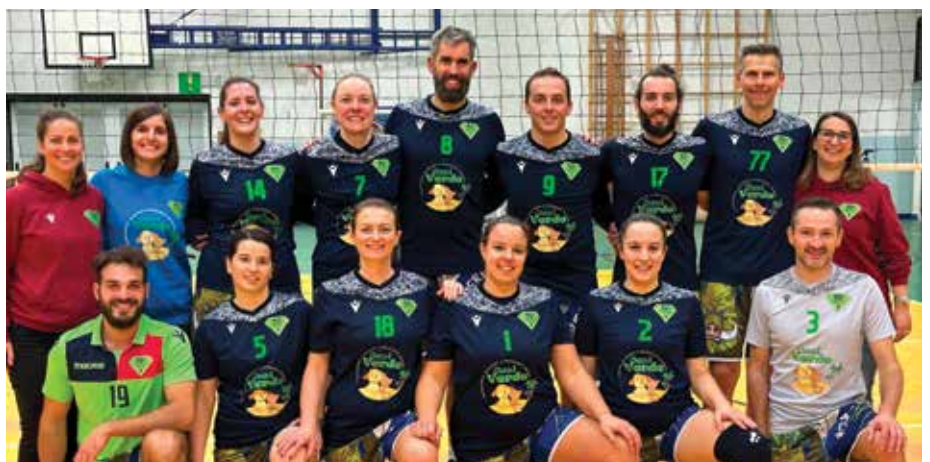
Misto "Super Volley Campiglia"