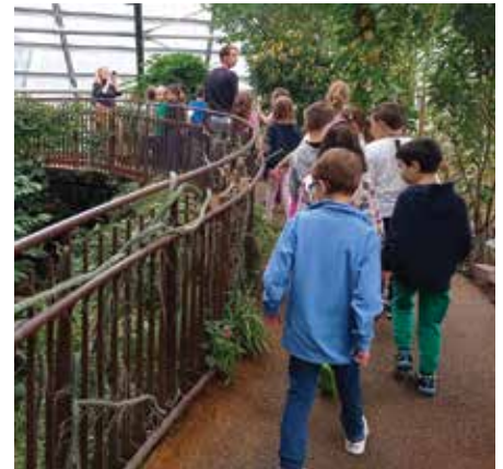
Visita al Muse di Trento

Il giorno 31 ottobre le nostre classi hanno vissuto esperienze uniche al Museo, il museo delle Scienze di Trento. Gli alunni hanno avuto la possibilità di visitare liberamente il museo, nei suoi sei piani, rimanendo ammaliati e dimostrando un notevole entusiasmo e curiosità. La visita si è arricchita grazie alla partecipazione a laboratori guidati da esperti che hanno coinvolto attivamente tutti gli studenti. Le classi seconda e terza hanno realizzato, a gruppi, dei plastici raffiguranti paesaggi diversi che hanno preso forma grazie all'unione delle idee di ciascuno. Tale attività collaborativa è stata svolta all'interno del laboratorio "Costruire e raccontare paesaggi" che ha consentito ai bambini, anche grazie all'ascolto di un racconto illustrato, di comprendere l'importanza di prendersi cura dei luoghi che ci circondano. Gli studenti di classe quarta sono diventati biologi per un giorno, cimentandosi nell'osservazione di molteplici strutture cellulari grazie al laboratorio "Piante al microscopio". In una sala multimediale 3D; infine, gli alunni di classe quinta sono stati coinvolti nel laboratorio "A caccia di costellazioni" approfondendo così la tematica astronomica. L'uscita didattica ha avuto un esito positivo e soddi-