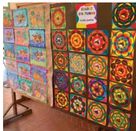
Mostra dei disegni degli alunni della scuola primaria per la Festa del Ringraziamento